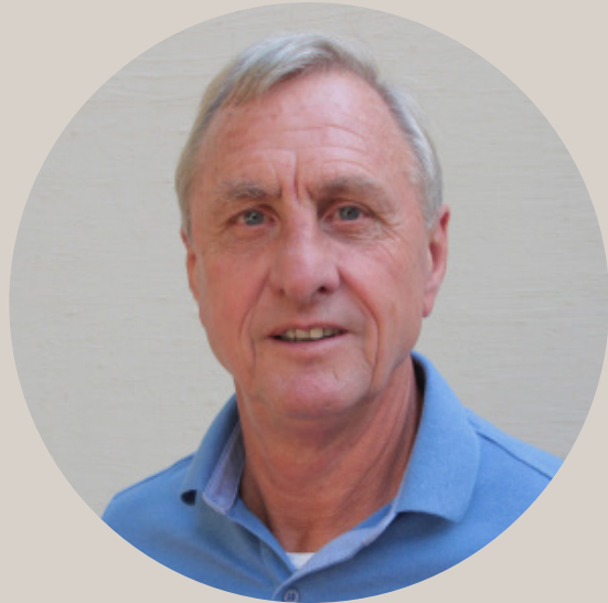
Johan Cruyff Fundador